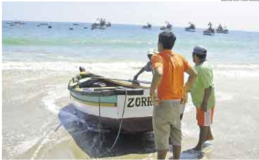
VARAZÓN. Entre las especies varadas, la que más abunda es la mojarilla. Habrían muerto por falta de oxígeno.

El fenómeno se ha presentado dos días seguidos. Pescadores están preocupados