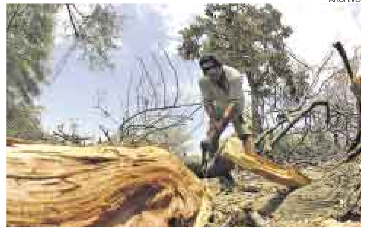
CONTRA ILEGALIDAD. Se pondrán dos camionetas más para ejercer mayor control en la zona a fin de frenar la tala.