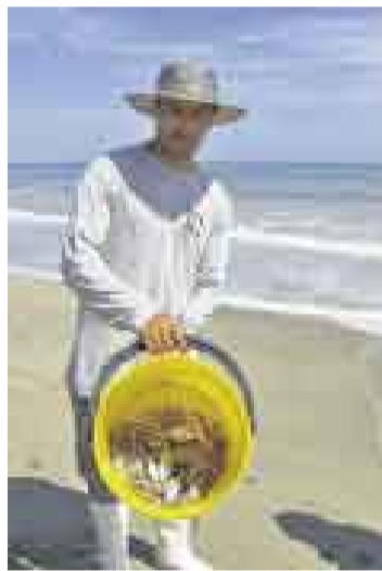
JUVENILES. Las especies varadas eran de poco tamaño.

Un evento anormal ha alertado a pescadores y pobladores de las costas de Tumbes. Desde hace dos días, cientos de peces pequeños, de edad juvenil, quedaron varados entre las caletas de La Cruz y Los Pinos. De acuerdo con las primeras investigaciones, estos ejemplares habrían fallecido por falta de oxígeno.