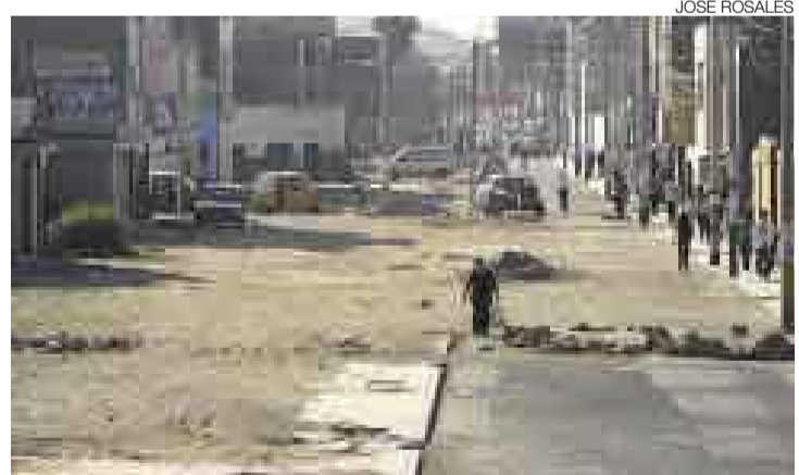
OLVIDO. Los vecinos de la avenida San Martín reclaman los escasos avances en la pavimentación de esta vía y la situación irregular de sus viviendas.