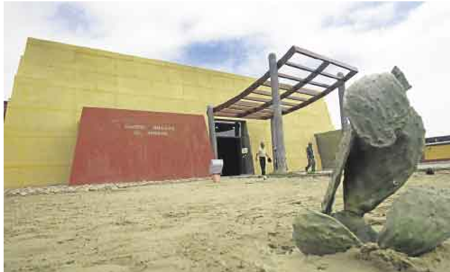
CENTRO CULTURAL. El museo permitirá que los turistas permanezcan hasta tres horas en la zona. Antes el máximo permitido era de una hora y media.

■ Nuevo local está dedicado a mostrar la riqueza cultural de los moches