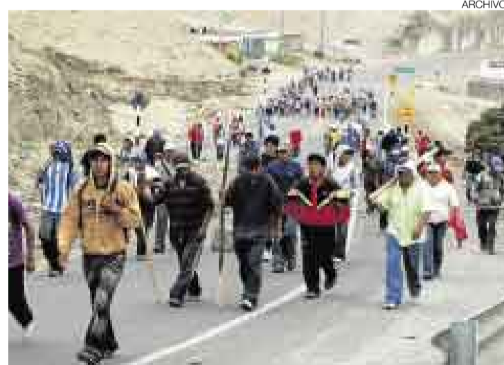
POR TEMOR. Los apristas afirman que la alianza con Cambio Radical se dio para evitar que la población los agrede debido a su posición política.

Según el dirigente aprista, antes de las elecciones realizadas el pasado domingo los militantes de esas dos provincias solicitaron formalizar la alianza con Cambio Radical. Entonces se elevó en consulta a la secretaria re-