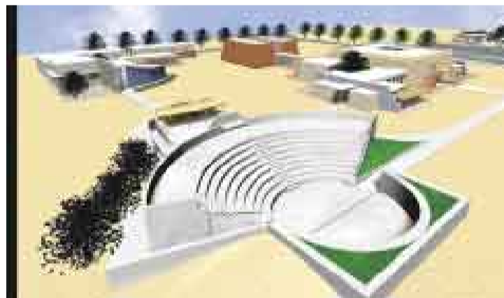
NUEVA SEDE. La construcción del museo Huacas de Moche costó alrededor de S/. 11 millones. El nuevo complejo cultural ocupa 6,5 hectáreas.