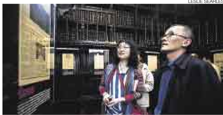
BIENVENIDOS. Personal de Zhejiang Daily Press Group en nuestra sede.