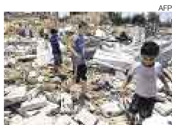
DRAMA. Quedaron sin nada.