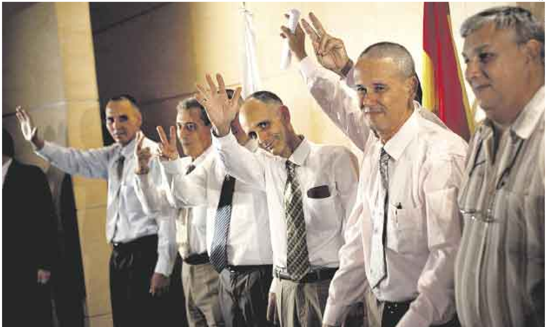
LIBRES. El primer grupo de presos políticos cubanos excarcelados por el régimen de los hermanos Castro saluda a los periodistas a su llegada al aeropuerto internacional de Barajas, Madrid.