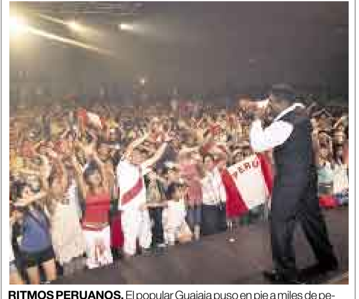
RITMOS PERUANOS. El popular Guajaja puso en pie a miles de peruanos en el show que presentó en la capital española.

justa y humana que saque de la clandestinidad a 12 millones de indocumentados.