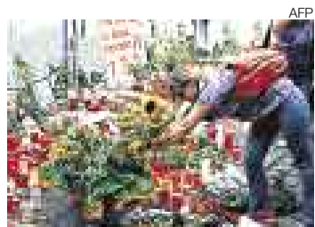
MUERTE. Culpas a organizadores.