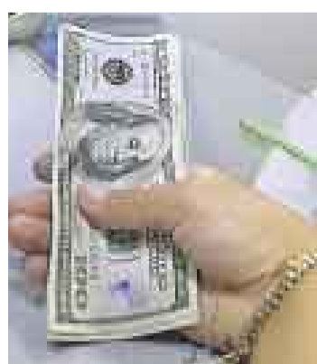
COMPRAS. El BCR estuvo activo en el mercado cambiario.

En la semana se acentuaron las presiones a la baja sobre el dólar, a tal punto que llegó a negociarse por debajo de S/.2,80 en el mercado interbancario. Las compras de dólares del Banco Central de Reserva (BCR) hicieron que la cotización del billete verde cerrara levemente por encima de S/.2,80.